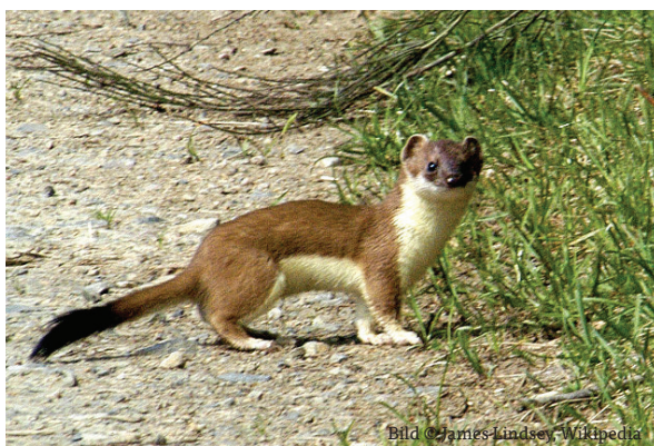
Das flinke Hermelin ist ein geschickter Mäusefänger.

Nach dem Queren der Hetschisruus führt der Weg bald zum Waldrand. Nun verläuft der Fusspfad zwischen Wiesen und Weiden abwärts Richtung Fahrsträsschen. Auf der rechten Seite ist der Weg von einer Hecke ge-