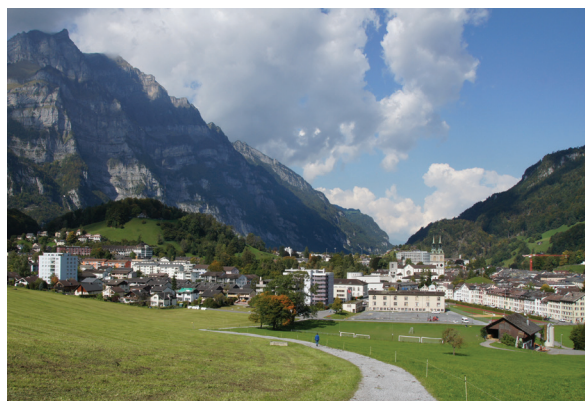
Die Stadt zu Füssen: auch das letzte Wegstück lohnt sich!

Vor dem Trasse des Skilifts folgt der Pfad rechts dem Bachbett steil abwärts nach Glarus. Beim Abstieg bietet sich ein herrlicher Blick auf die Stadt mit dem gut an der Antenne erkennbaren «Bergli». Der Hügel ist in prähistorischer Zeit durch einen Bergsturz vom Glärnisch entstanden. Talauswärts erkennt man am rechten Hang das Abbaugelände der Kalkfabrik Netstal. Die Kulisse bilden die Berge: auf der linken Seite vom Dejenstock über den Wiggis talauswärts bis zum Plattenberg und rechts von den Ennetbergen, dem Fronalpstock im Hintergrund bis zum Schilt ob Ennenda.